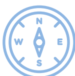
Halaman Panduan Lengkap Etika & Kepatuhan