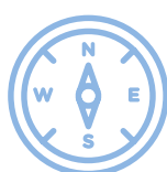
Páginas de Ética e Conformidade na Pulse